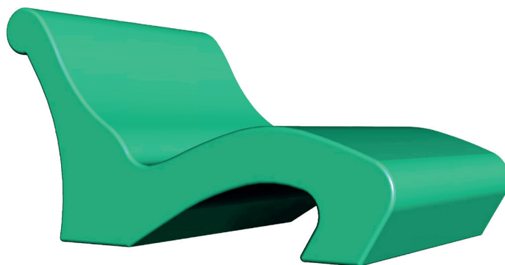
draufsicht & ansicht / top view & side view