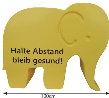
draufsicht & ansicht / top view & side view